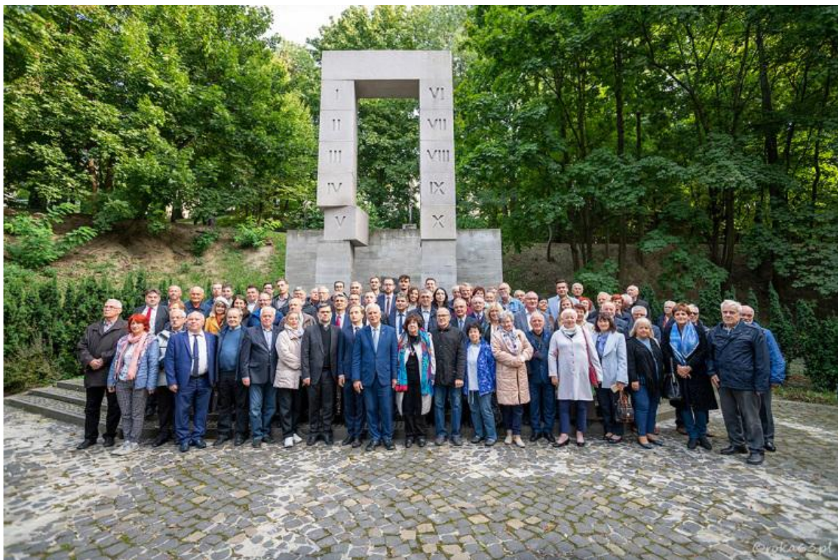
Uczestnicy uroczystości 100-lecia SEP we Lwowie, przed pomnikiem pomordowanych Profesorów Lwowskich na Wzgórzach Wuleckich.

Zostały podpisane ramowe umowy o współpracy pomiędzy SEP i Instytutem Elektrodynamiki NAN Ukrainy oraz SEP i Związkiem Naukowo-Technicznym Energetyków i Elektrotechników Ukrainy.